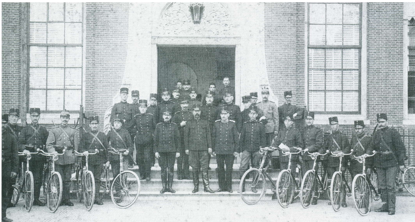
Overste Luden, te midden van zijn staf voor het Stadhuis

In de jaren 1913 tot en met 1918 speelde Emil Luden een belangrijke rol in onze stad en naaste omgeving. Zijn oudst bekende voorvader was Johan Luden, geboren te Bergen in 1668 in Noorwegen en overleden in 1737. Hij vestigde zich aan het einde van de zeventiende eeuw in Amsterdam als stokviskooptman.